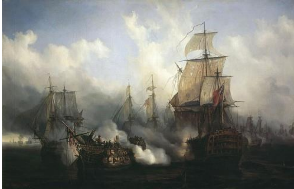
Batalla de Trafalgar